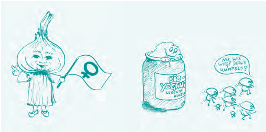
Abb. 1: Illustrationen zum Vortrag »Selbsthilfe bei häufigen vaginalpilzinfekten« im FFGZ Kiel e.V. 1992 – heute würde ich weder Knoblauchzehen für die vaginale Anwendung empfehlen, noch Joghurt, aber das ist eine andere Geschichte.

Nach ein paar Jahren stieg ich dann auf eine Portiokappe um. Auch Kondome waren wieder Thema, nachdem meine erste Beziehung zu Ende war, was unfreiwillig zu einem Selbstversuch mit der »Pille danach« führte. Damals noch die Yuzpeh-Methode (Tetragynon): Was war mir schlecht! Bloß nicht neben das Mikroskop erbrechen! Und ich saß an diesem Morgen in der ersten Reihe vor unserem Professor ... Die modernere Nachverhütung ist Göttin sei Dank nicht nur effektiver in der Verhütung von Schwangerschaften, sondern auch viel besser verträglich, wie im Kapitel 10 »Nachverhütung« beschrieben. Die vier Tabletten blieben drin, kein Kind im Medizinstudium, erst mal war alles wieder gut.