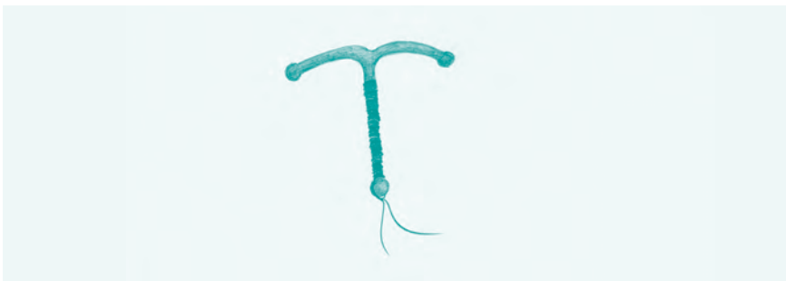
Abb. 13: T-380: Je nach Größe (klein, mittel, groß) 3 bis 3,8 cm lang mit einer Spannweite von 2,4 bis 3,65 cm

In Dänemark können Frauen auf Kosten des öffentlichen Gesundheitssystems eine Spirale bekommen, leider nach genau diesem Strickmuster. Eine Freundin von mir, die mit einem Dänen verheiratet ist, fragte mich vor einigen Jahren, warum um alles auf der Welt ich Spiralen legen würde. Sie hätte seit der Einlage ihres IUP vor vier Monaten ständige Unterbauchbeschwerden. Es stellte sich heraus, dass sie nach drei Schwangerschaften mit zwei Geburten und einer Fehlgeburt eine Nova-T-Spirale bekommen hatte, die oben relativ breit ist. Sie hatte aber eine sehr schmale Gebärmutter – mit einer guten Rückbildung kann auch nach dem zweiten oder dritten Kind die Gebärmutter wieder sehr eng werden. Als Voruntersuchungen hatten ein Krebsfrüherkennungsabstrich und ein Blick unters Mikroskop ausgereicht, ein Ultraschall war nicht durchgeführt worden. Wie gesagt, das muss auch nicht sein, aber die »Trefferquote« wird höher und somit bleiben mehr Frauen nebenwirkungsfrei. Ich tauschte ihre Spirale gegen ein langes Gynefix aus, dass sie jetzt im dritten Jahr beschwerdefrei trägt. Nach den Ausführungen, könnte frau denken, kleiner sei immer besser – nein, zu große Schuhe machen auch keine Freude. Zu kleine Spiralen können schnell in der Gebärmutter verrutschen oder herausfallen. In Israel wurde eine Verhütungskette mit Kupferperlen (IUB = intrauterine ball) entwickelt, die in der Gebärmutter die Form eines