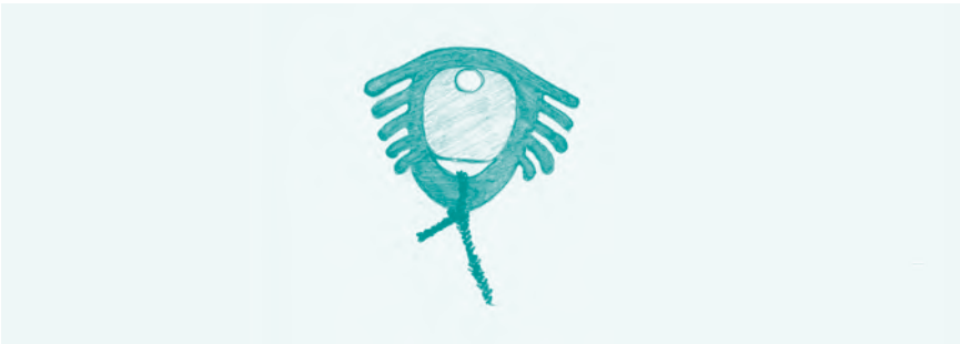
Abb. 11: Dalkon-Shield: 2,5 x 2,2 cm. Es war erstaunlich klein, für den Ärger, den es verursacht hat ...

Alle diese frühen Modelle der intrauterinen Verhütung hatten ein Problem: Ihre Wirkung beruhte auf ihrer Größe. Sie verhüteten umso sicherer, je mehr Kontakt sie zur Gebärmutterwand hatten und dort die Schleimhaut irritierten. Aber die großflächigen Druckstellen führten bei vielen Anwenderinnen auch zu starken Menstruationskrämpfen und hohem Blutverlust. Blutarmut und monatliche Krämpfe waren für viele Frauen der Preis für die sicherste Verhütungsmethode, die es bis zur Mitte der 1960er-Jahre gab.