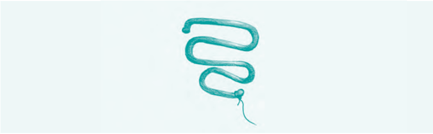
Abb. 10: Lippes-Loop: 4,5 x 4 cm. Zuletzt 1974 auf dem deutschen Markt erhältlich, das letzte der wirkstofffreien IUP, danach gab es nur noch Kupferspiralen und später die Hormonspiralen mit Levonorgestrel.