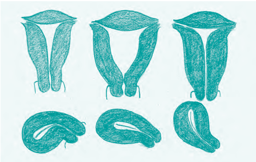
Abb. 12: Verschiedene Formen der Gebärmutter: Manche sind weit, andere eng und schmal, manche gebogen oder nach hinten abgeknickt. Die obere Reihe zeigt die Ansicht von vorne, die untere von der Seite. Seitlich gesehen entspricht die Gebärmutterhöhle eher einem Spalt.

In der Praxis, in der ich Ende der 1990er-Jahre meine Facharztausbildung beendete, wurden Multiload (ovales IUP mit Häkchen) in zwei Größen gelegt: die normalen für die Frauen, die schon geboren hatten, und die kleinen für Frauen ohne Kinder. Fertig! Und damit kamen vielleicht 80 Prozent der Frauen auch gut klar. Bei denen, die starke Blutungen hatten, auch nach sechs Monaten noch über Zwischenblutungen klagten oder unter Schmerzen litten, wurde die Spirale vorzeitig wieder entfernt. Da Schmerzen und Blutungsprobleme zu den bekannten Nebenwirkungen gehörten, die ein Teil der Frauen einfach hat-